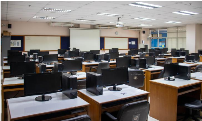
ห้องปฏิบัติการคอมพิวเตอร์ 3