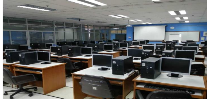
ห้องปฏิบัติการคอมพิวเตอร์ 2