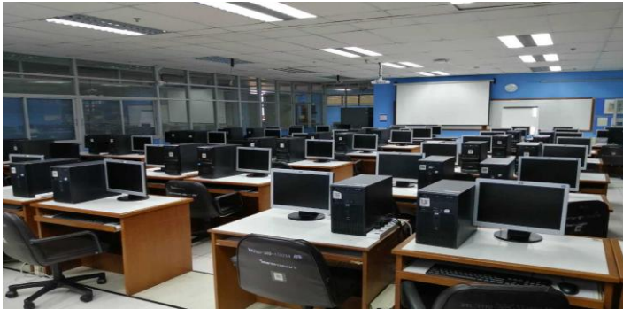
ห้องปฏิบัติการเครือข่าย