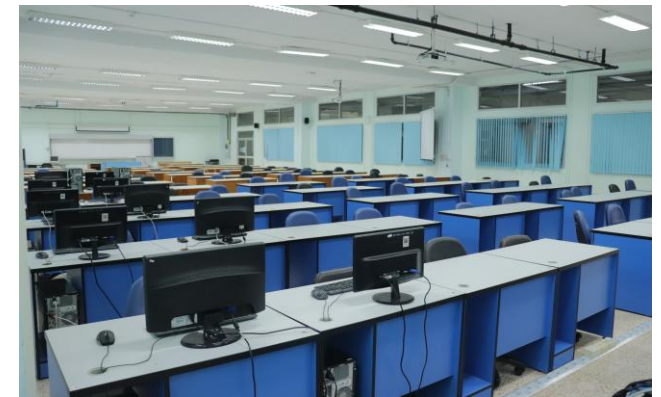
ห้องบรรยาย 3203