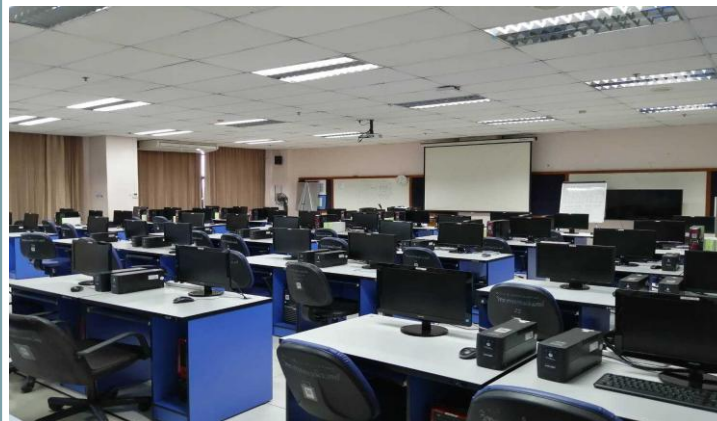
ห้องปฏิบัติการคอมพิวเตอร์ 4